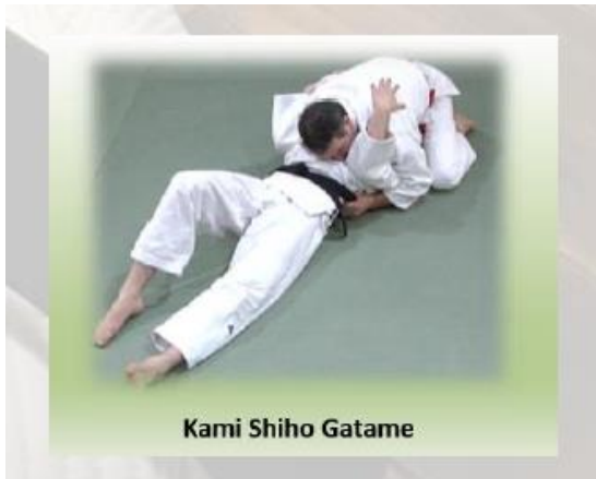
Kami Shiho Gatame